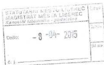
Jiří Turner Technik rozvoje vn, nn Oddělení Rozvoj Sever

Příloha : 1x Situace s umístěním TS 1x Orientační umístění TS v terénu 1x Výpis z katastru nemovitostí 1x Katastrální mapa 1x Pověření