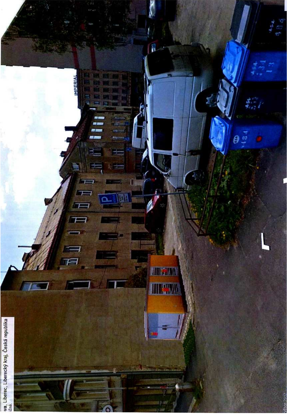
va, Liberec, Liberecký kraj, Česká republika izná.